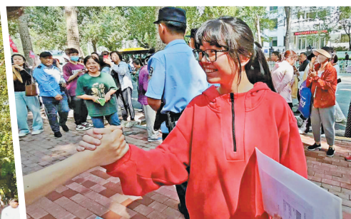
生活报讯(记者吕晓艳)我省普通高考将于6月7日至10日举行,全省共设101个考区、212个考点,8000余个考场,19.2万名考生参加考试。

据悉,全省成立了由省教育厅领导带队的13个高考督导组,全程对负责地域进行督导巡视。选派300余名省派巡视员奔赴全部101个考区、212个考点开展考试考点包楼巡查。高考期间,成立考场视频监控巡查小组,对全部考场开展网上巡查。