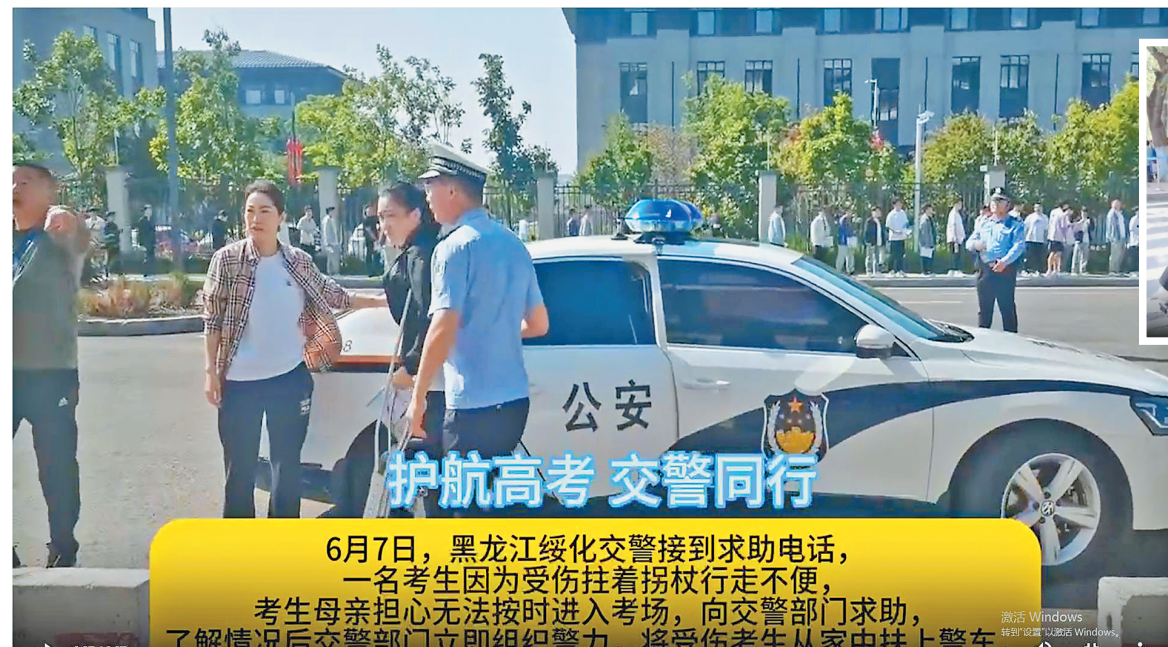
6月7日,黑龙江绥化交警接到求助电话,一名考生因为受伤拄着拐杖行走不便,考生母亲担心无法按时进入考场,向交警部门求助,了解情况后交警部门立即组织警力,将受伤考生从家中扶上警车