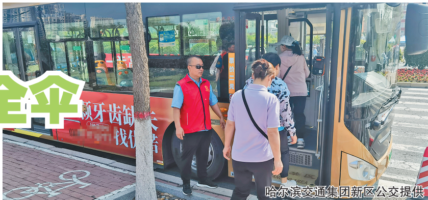
哈尔滨交通集团新区公交提供

生活报讯(何子健 记者何兴丽 仲亮 栾德谦 史天一)6月7日,2024年高考拉开序幕,哈市多部门采取多项举措,全力以赴为广大考生提供更加细致周到的服务,助力高考。