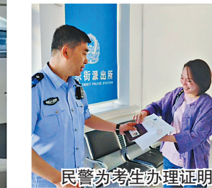
民警为考生办理证明