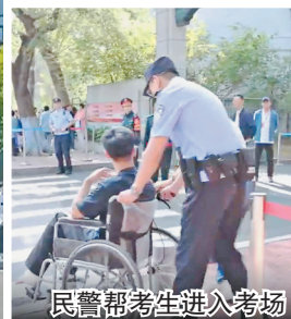
民警帮考生进入考场