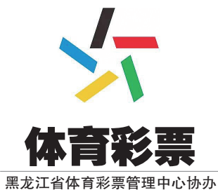
黑龙江省体育彩票管理中心协办

体彩公益金超过212亿元,极大助力了我省体育事业的发展。2023年全省体育彩票销售60.09亿元,同比增长30.52%,筹集公益金14.66亿元,同比增长27.73%。