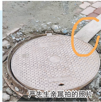
严先生亲属拍的照片