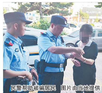
民警帮助被骗居民

生活报讯(王健南 记者时继凯)近日,哈尔滨市通河县的街头上演了一场民警救助群众、与电信诈骗人员进行时间赛跑,成功阻止电信诈骗的一幕,及时为市民止损十万元。