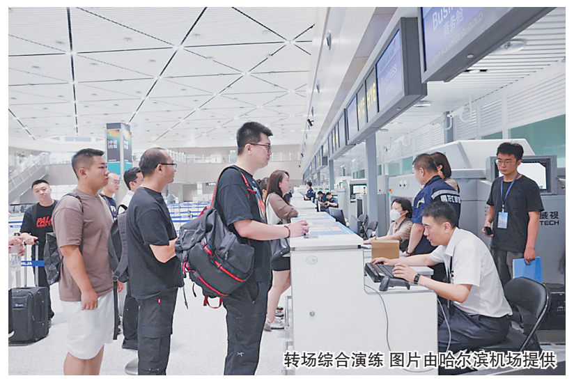
航站楼,办理乘机手续。12日起,哈尔滨机场T1航站楼正式启用,所有出境航班旅客,请到T1航站楼办理值机候机以及接机。

据了解,T1航站楼国际区使用面积约为4.7万平方米,其中一层主要包括远机位候机区和旅客到港区,二层为旅客出港层,共设置近机位登机口6个、远机位登机口1个、值机柜台30个、出港海关、安检共用查验通道11条、海关托运行李先期机检系统一套、海关手提行李查验通道3条,实现旅客一次过检,提升服务体验。此外,哈尔滨机场T1航站楼还有边检出入境人工通道22条、快捷通道14条。T1航站楼国际区投用,将大大提升旅客容量,为国际航空市场开发、推进哈