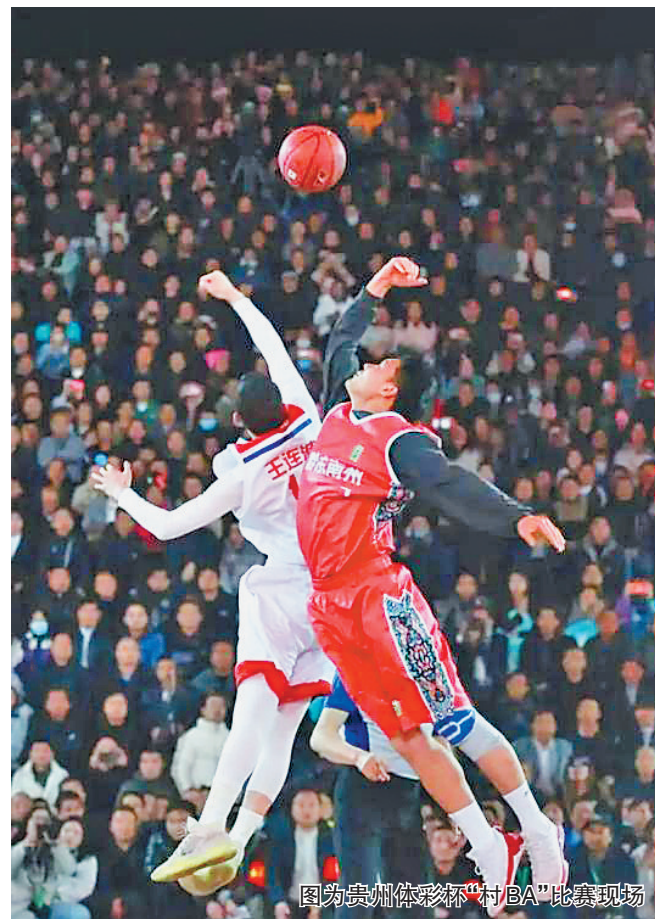
图为贵州体彩杯“村BA”比赛现场

在山东省济宁市的曲阜体育公园,这里已成为百姓的健身乐园,曲阜体育公园累计投入655万元体彩公益金用于设施的升级改造。其中,投入171万元新建体育公园笼式足球场2块、笼式篮球场4块、乒乓球桌8块;投入198万元维修改造体育场馆塑胶跑道,286万元用于田径场看台、围墙、照明、视频监控等项目改造提升,满足了周边10万社区居民的休闲健身需求;在广东省揭阳市,升级后的健身广场集体育健身娱乐于一体,经常聚集着不少锻炼休息的居民;在河南省郑州市经开中心广场上,健身器材、仰卧起坐平台、压腿训练器、转腰器等户外健身器材应有尽有。