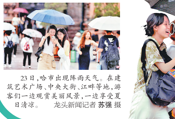
23日,哈市出现阵雨天气。在建筑艺术广场、中央大街、江畔等地,游客们一边观赏美丽风景,一边享受夏日清凉。