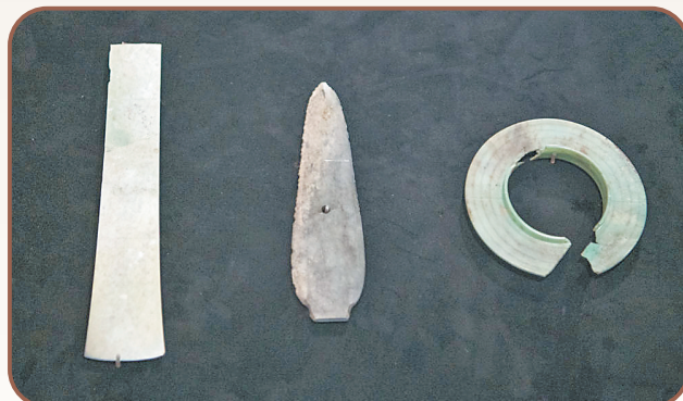
这是在四川省广汉市拍摄的三星堆遗址发掘区出土的玉器(2024年7月21日报)。