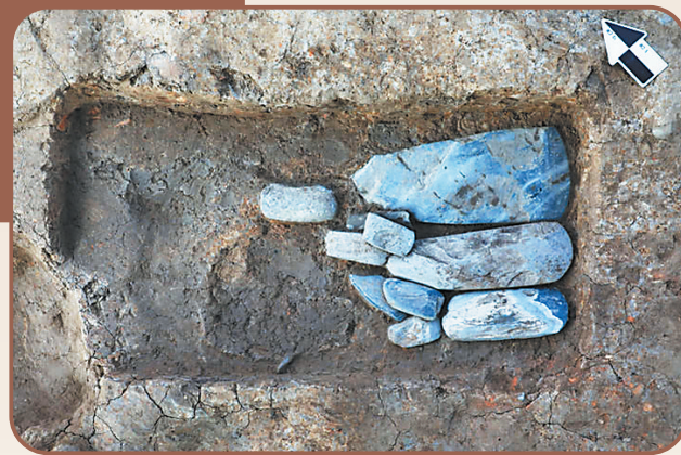
这是2023年3月14日拍摄的四川省广汉市三星堆遗址发掘区的石斧坑第四层。

据雷雨介绍，商代大型都邑手工业作坊往往位于同一个区域，相当于现代的工业区，或许可以由此顺藤摸瓜，寻找青铜器制作作坊、金器制作作坊等。