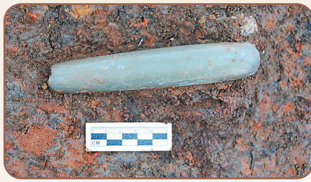
这是2023年4月24日拍摄的四川省广汉市三星堆遗址发掘区出土的玉器(2024年7月21日报)。