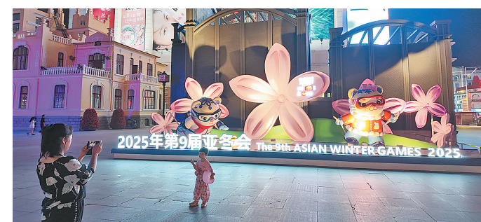
近日,哈市南岗区在秋林博物馆区域新增设花卉灯饰,扮靓城市核心商圈。