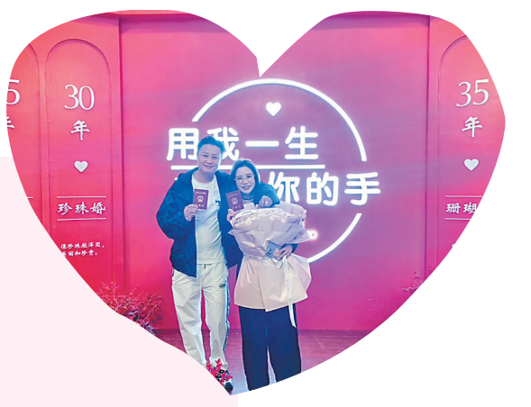
用我一生 许你一世

化。此外,呼兰区还将全面完成婚姻登记历史档案补录工作,实现所有现存纸质档案的电子化,进一步推进婚姻登记历史档案规范化建设,提升婚姻登记管理信息化水平,为居民查阅历史档案提供便利条件。