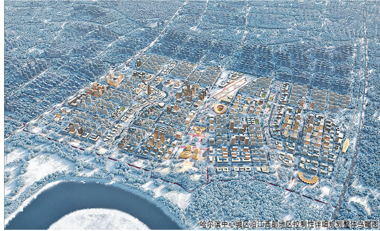
哈尔滨中心城区沿江西部地区控制性详细规划整体鸟瞰图

生活报讯(记者梁晨)记者近日从哈尔滨市自然资源局获悉,依据《哈尔滨市国土空间总体规划(2021—2035年)》《哈尔滨松花江百里长廊生态保护和高质量发展规划》及相关专项规划,哈尔滨中心城区沿江西部地区控制性详细规划出台,该规划涉及位置及范围为:西起四环路快速路、南至群力第五大道、东至西三环快速路,北至友谊西路延长线的围合区域,面积约752.6公顷。