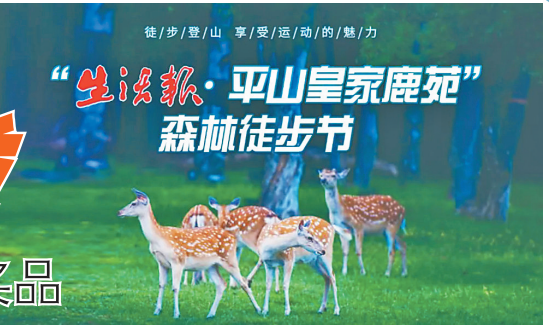
“生活报·平山皇家鹿苑”森林徒步节