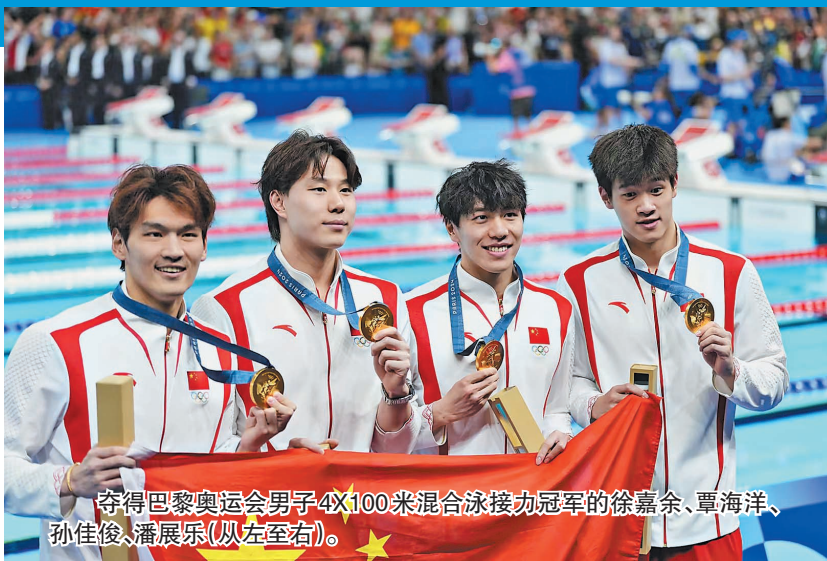
夺得巴黎奥运会男子4x100米混合泳接力冠军的徐嘉余、覃海洋、孙佳俊、潘展乐(从左至右)。

自1995年“奥运争光计划”颁布实施后,国家体育总局每年都会拿出一部分彩票公益金用于支持该计划,截至2023年年底已累计支出超130亿元。