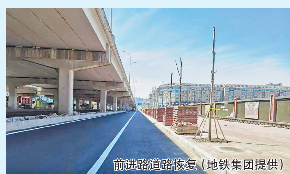
前进道路路恢复

都在15米,有的基坑长度达160余米。在基坑开挖过程中面临周边高层建筑多、紧邻友谊路繁华主干道,同时地质结构属于富水砂层,施工风险极大。