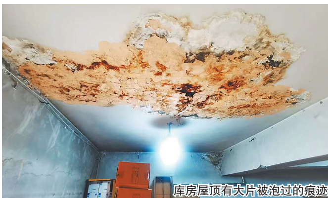
库房屋顶有大片被泡过的痕迹