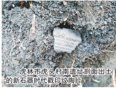
虎林市虎头村南遗址剖面出土的新石器时代戳印纹陶片