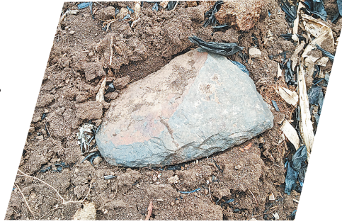
穆稜市七华里沟遗址采集石铲

这为我省新石器时代农业起源及早期发展的研究提供了宝贵资料。早期农业实物遗存的诞生,也实证了黑龙江大地距今四千五百年的农业起源与发展史。据介绍,下一步,考古调查队将继续对宝清、饶河、抚远等地区展开调查,届时将摸清乌苏里江流域新石器时代遗址的总体分布情况,并进行室内整理、样品检测、报告编写等工作。