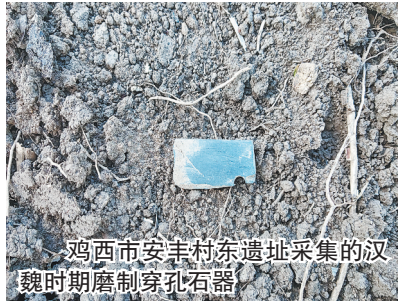
鸡西市安奎村东遗址采集的汉魏时期磨制穿孔石器