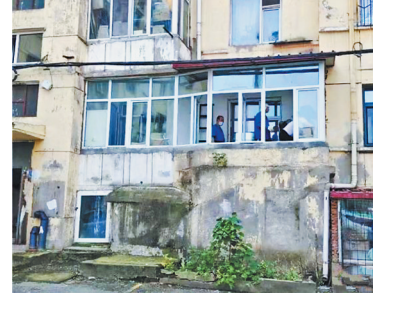
由南岗区执法局提供

生活报讯(记者于海霞)记者了解到,哈市南岗区城市管理行政执法局日前集中拆除两处违建。日前,该局执法人员通过前期细致的排查走访,对违法建筑进行了逐一登记,并向相关责任人下达了整改通知,但仍存在部分未在定期限内自行拆除的违法建筑。文林街存在一处18平方米的违建门斗,经执法人员与当事人多番沟通劝导无果,直至拆除队伍到达现场,当事人才自行拆除。人防小区一处违法扩建的居民楼阳台也在此次行动中被拆除,该处违建阳台下面是防空洞口,不仅破坏了小区的整体美观,还有安全隐患。执法人员在积极做好拆违思想动员工作的同时,帮助当事人拆除私扩阳台,做好阳台清理工作,并联系对接了塑钢门窗制作等拆后修复工作。图片由南岗区执法局提供