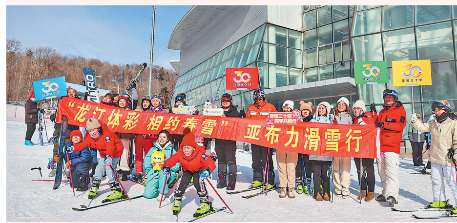
滑雪爱好者参加龙江体彩组织的亚布力免费滑雪活动