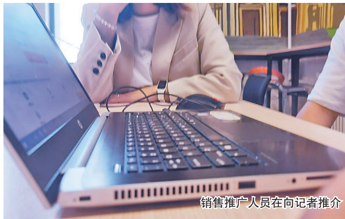
销售推广人员在向记者推介

等着接单即可。记者称自己不会防水业务,没有成立公司,而这两位销售人士表示:“这个完全没有必要顾虑,不用注册公司,只要会接电话,能说明白漏水的原因即可。”“你可以说自己是客服,具体让工人去现场查看,还显得你们‘公司’很正规。”同时,推广人员表示,只需要在后台实名认证,但是在平台注册商家时,可以没有实体店,商家名字也可以随意起,可以是虚拟的,可以不是真名。