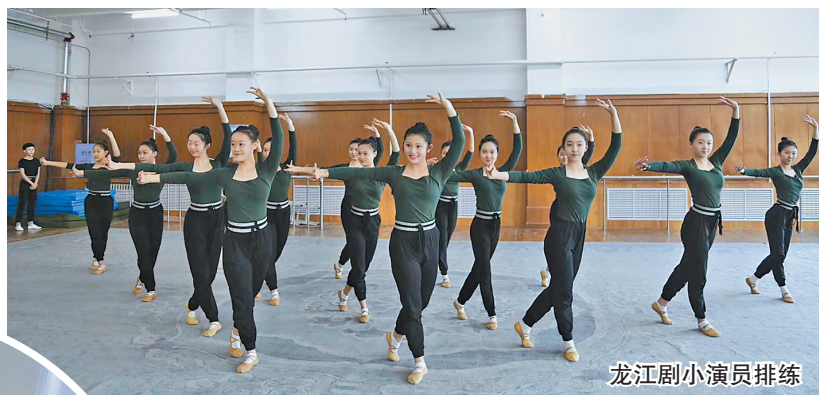
龙江剧小演员排练