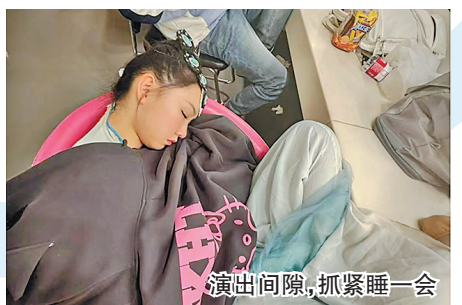
演出间隙,抓紧睡一会

“戏比天大”是戏曲人始终坚守的职业精神,也是他们镌刻在骨子里的信念。省京剧院、省龙江剧艺术中心、省评剧艺术中心的演员,有的人父亲刚在上午出完殡,下午就要强忍着悲痛随团到外地演出;有的人刚收到母亲的病危通知,晚上也一刻不敢耽误地跑回剧院完成演出……他们常说:规矩就是规矩,心怀观众,戏比天大,方为初心。