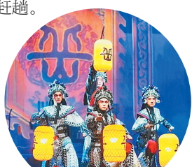
龙江剧《岳云》演出照