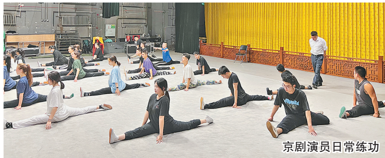
京剧演员日常练功