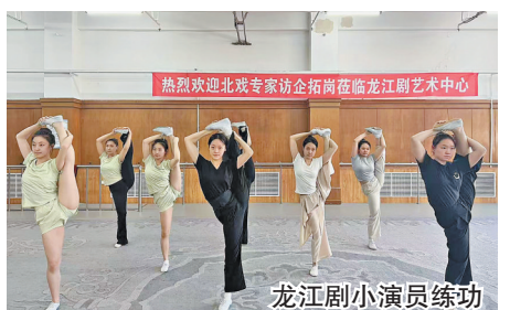
龙江剧小演员练功