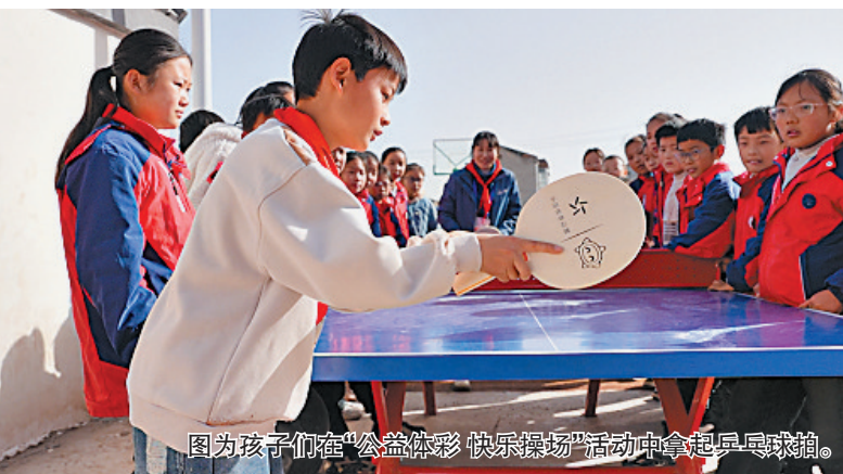
图为孩子们在“公益体彩快乐操场”活动中拿起足球球。

“公益体彩快乐操场”自2012年发起以来,全国体彩机构投入7131万元,走进4055所经济欠发达地区缺乏体育器材和教育资源的中小学校,既改善了学校的软硬件条件,也间接地促进了教师体育教学水平的提升,为他们提供了更加丰富多样的教学手段和资源。