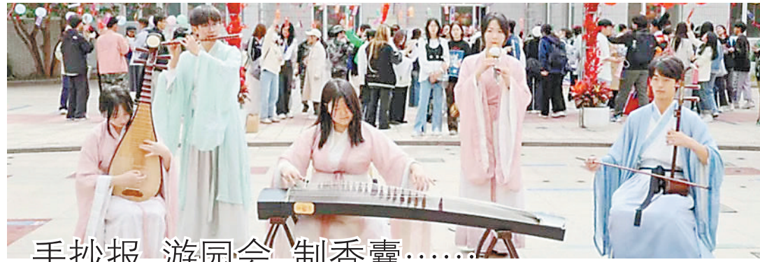
手抄报、游园会、制香囊……

受理地址:哈尔滨道里区地段街1号生活报一楼阳光大厅 刊登 84681180 电话 15004697804