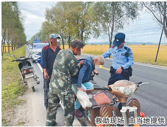
救助现场

原来,这位老人今年已经96岁了,患有阿尔茨海默病,当天早上吃完早饭后家人发现她突然不见了,四处寻找未果后报警求助。获知老人在公路上被民警发现后,家人迅速赶来接老人回家,老人的儿子向民警表示感谢,巡逻民警也嘱咐家属,一定要做好看护工作,避免老人再次走失,发生危险。