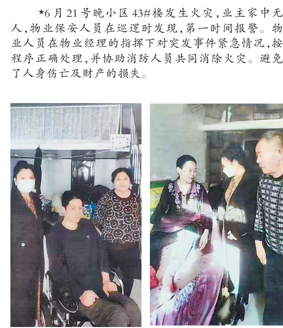
*阳光物业慰问、帮扶困难业主十二户,每年帮助他们免收物业费、送油、送米、清扫卫生等,对军属、退伍军人进行特别关爱,年节慰问,生活关注,工作关心。