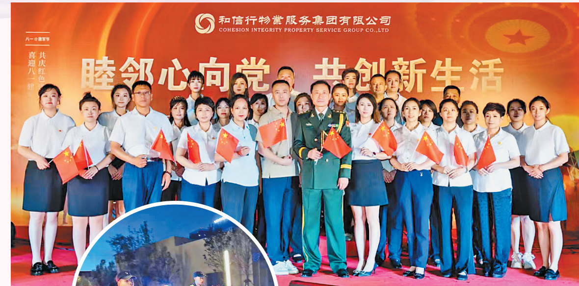
“七彩阳光” 物业党建理论模型

2006年和信行物业服务集团在哈尔滨市正式注册成立,管理团队均来自于全国物业行业头部企业,抱着扎根龙江、服务龙江的朴实情感,深耕这片黑土。经过十几年的奋斗,公司取得了国家一级物业资质,连续6年荣获全国物业服务企业综合实力TOP100,荣获东北品牌物业服务企业10强、中国物业服务满意度100强、东北智慧物业服务领先企业等荣誉,管理规模达1400万平方米,从业人员近五千人。