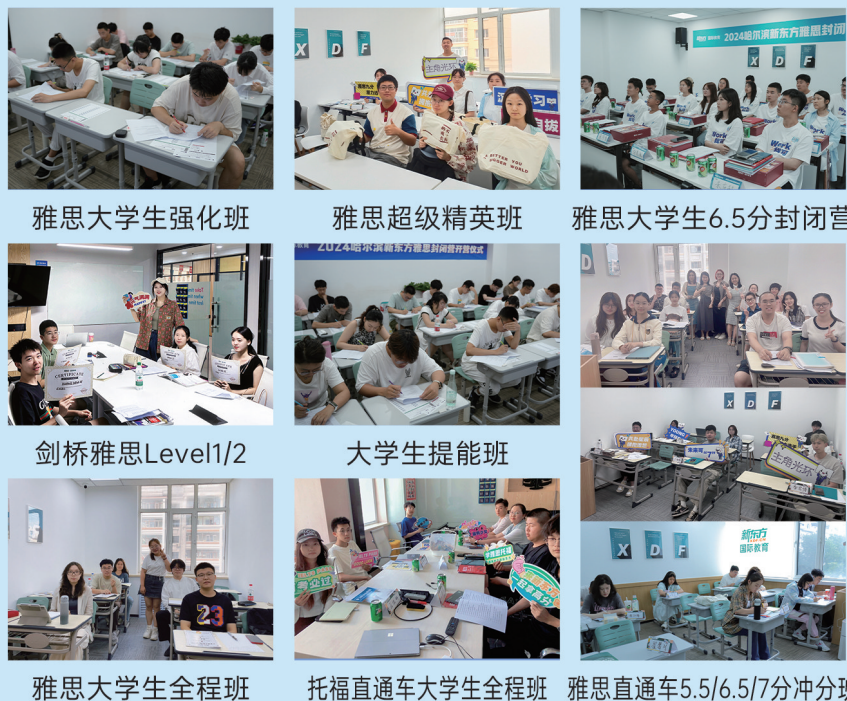
雅思大学生强化班 雅思超级精英班 雅思大学生6.5分封闭营 剑桥雅思Level1/2 大学生提能班 雅思大学生全程班 托福直通车大学生全程班 雅思直通车5.5/6.5/7分冲分班