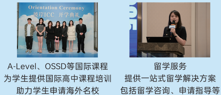
Orientation Ceremony 雅思ICC 开学典礼 A-Level、OSSD等国际课程 为学生提供国际高中课程培训 助力学生申请海外名校 留学服务 提供一站式留学解决方案 包括留学咨询、申请指导等

哈尔滨新东方国际教育的授课教师均为国内重点大学或以上学历，或具有海外留学经历，其中海外留学/硕士占比高达90%以上。 所有雅思教师成绩均达到7.5分+，托福教师成绩100分+，所授科目单项人均高分/满分。教师人均持有剑桥大学海外教师认证证书，CELTA持有者也不在少数。