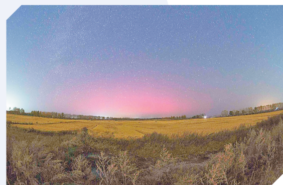
在佳木斯郊区平安乡拍的极光

结合太阳活动情况,国家空间天气监测预警中心10月4日曾研判,从10月4日起的未来三天,可能发生强地磁活动。在中国北方部分地区,尤其是黑龙江、内蒙古、甘肃、新疆等地,甚至是更靠南的一些省份,都有机会看到或拍摄到极光现象。