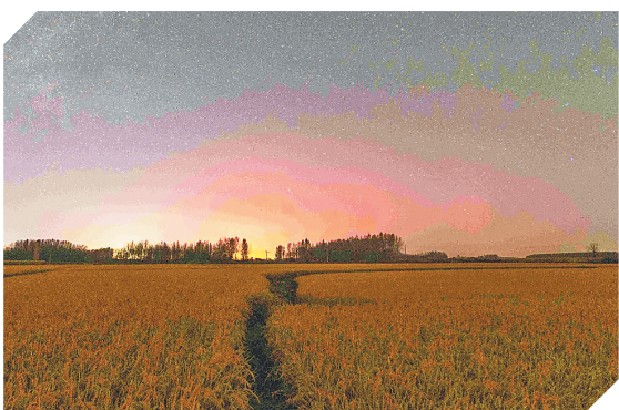
在佳木斯汤原县吉祥乡拍的极光