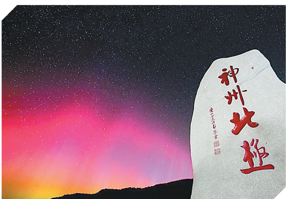
漠河极光(视频截图)