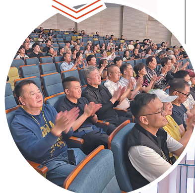
观众观看黑龙江文旅宣传片