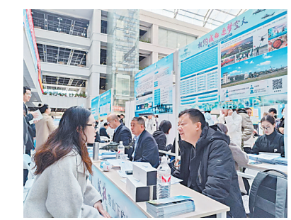
生活报讯(金声实习生单博杨、宁英、记者吕晓艳文/摄)记者了解到,东北五校2025届毕业生秋季大型双选会哈工程专场近日在该校启航活动中心举办。来自全国的500余家企业提供就业岗位近4万个,涵盖中船集团、中航工业、核工业等军工集团和哈电集团、华为、中兴等知名企业,厦门、西安、深圳等多地市人社局组团参会。