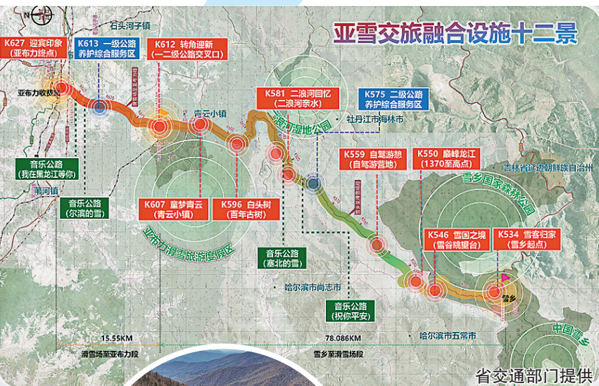
亚雪交旅融合设施十二景