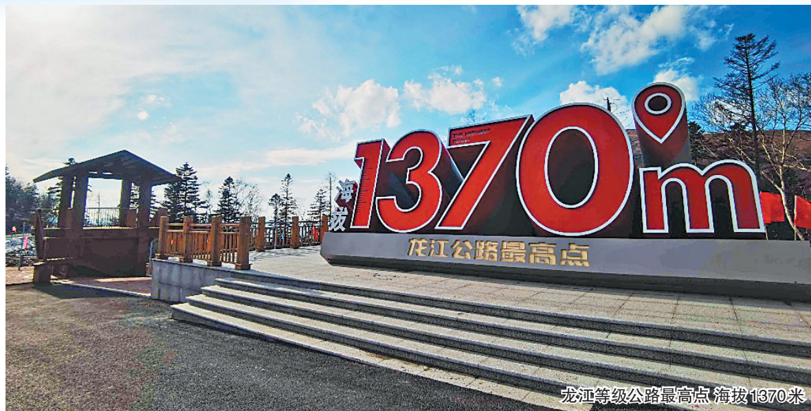
龙江等级公路最高点海拔1370米

生活报讯(实习生袁苑 记者栾德谦/摄)29日,记者从省交通部门获悉,国道三莫公路雪乡至亚布力段改扩建工程实现提前完工通车。据悉,亚雪公路是连接雪乡国家森林公园、亚布力滑雪旅游度假区的关键通道,也是2025年第九届亚冬会雪上竞技比赛场地的主要交通道路。