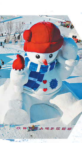
1月9日,游客在哈尔滨外滩雪人码头游玩。

备,摆放绿植盆景美化环境,根据需求增设移动式厕所。对标国内国际标准,结合龙江地方特色,完善旅游标识牌建设。