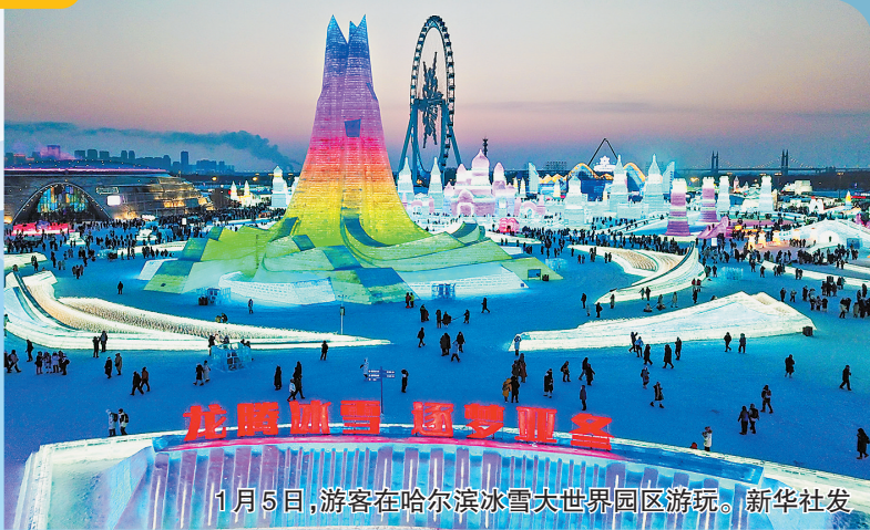
1月5日,游客在哈尔滨冰雪大世界园区游玩。