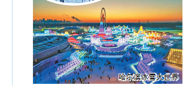
哈尔滨冰雪大世界