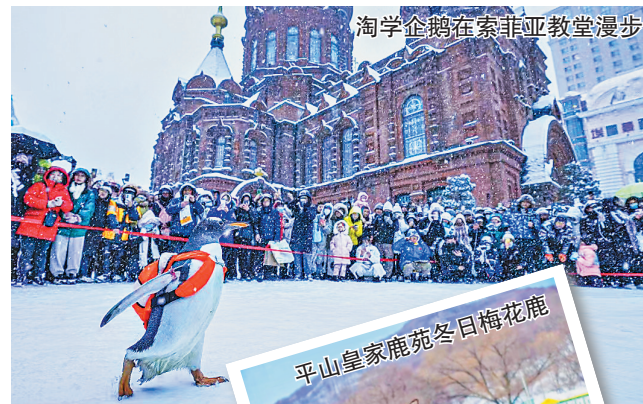
淘学企鹅在索菲亚教堂漫步

哈尔滨市文化广电和旅游局局长王洪新表示:“约会哈尔滨,冰雪暖世界。我们将以更优质的旅游产品、更贴心的旅游服务、更舒适的旅行环境,凸显冰雪的梦幻、点燃运动的激情、提供艺术的享受、焕发时尚的魅力、促进产业的释放,打造消费的天堂、激发味蕾的碰撞、温暖回家的旅程,为游客带来‘冰世界雪天下’的超凡体验。同时发出了‘让我们相约尔滨,逐梦亚冬’的邀约。”