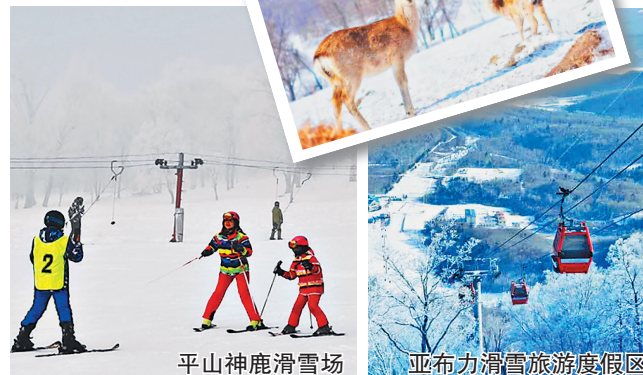
平山皇家鹿苑冬日梅花鹿