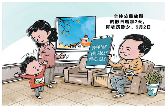
假日增加 商海春 作

《国务院关 于修改〈全国年 节及纪念日放 假办法〉的决 定》,及2025年 部分节假日安 排12日公布。 就社会各方面 关心的问题,有 关方面负责同 志接受了记者 采访。