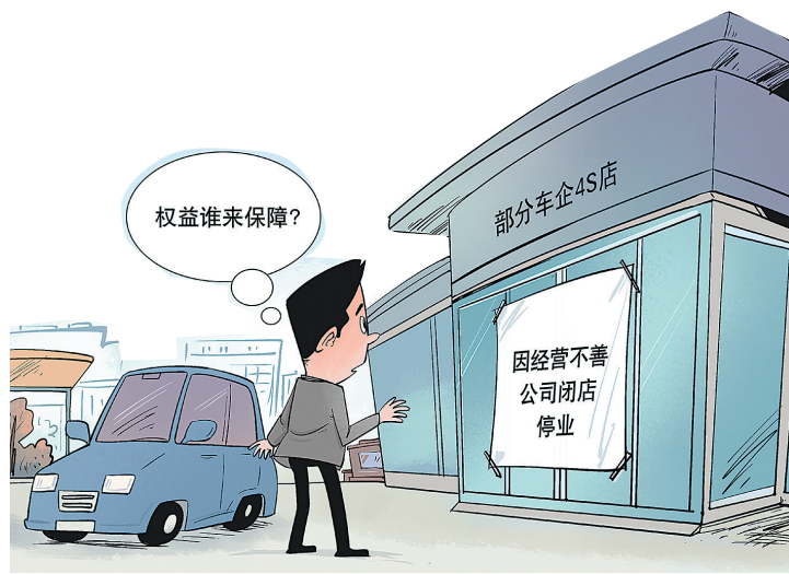
权益受损 新华社发 勾建山 作

明确调休原则。多年实践中,形成 了较为固定的调休原则。此次将调休 原则进行明确和公布,可以进一步稳定 各方面预期,群众可以对照原则自行规 划安排未来假期。