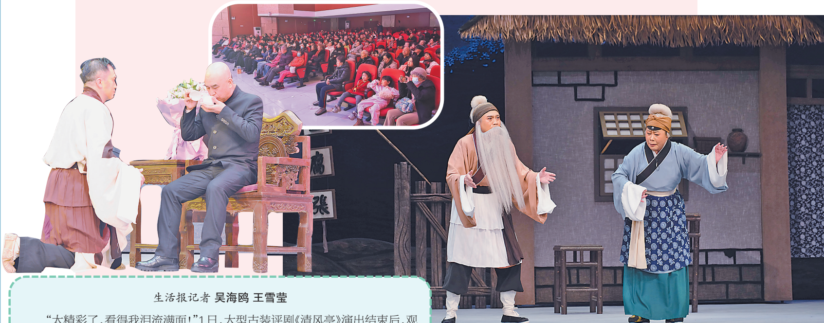
生活报记者 吴海鸥 王雪莹

“太精彩了,看得我泪流满面!”1日,大型古装评剧《清风亭》演出结束后,观众们仍沉浸其中,回味着剧情。作为2024年国家非物质文化遗产保护经费扶持剧目,评剧《清风亭》通过“张元秀”夫妇育子之艰辛、别子之痛彻、认子之悲愤、怨子之救贖,弘扬了中华传统孝道,鞭撻了忘恩负义的丑恶行径,呼唤了道德良知的回归,歌颂了人间大爱。