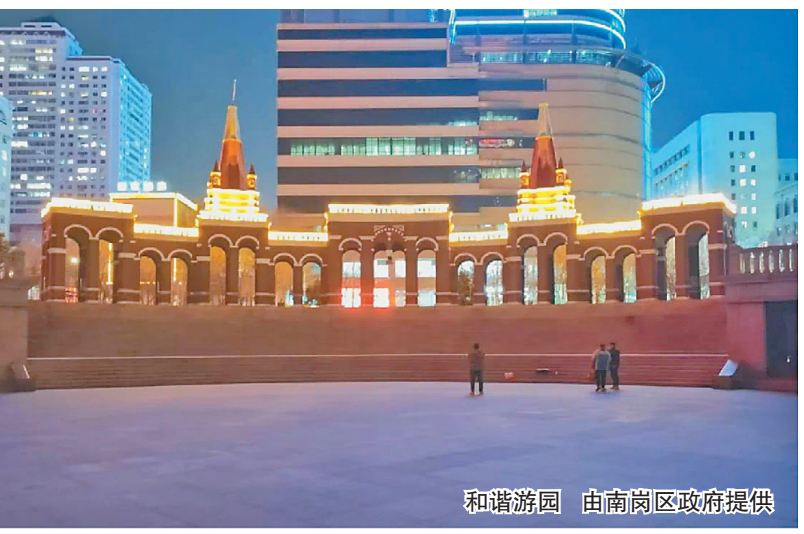
和谐游园