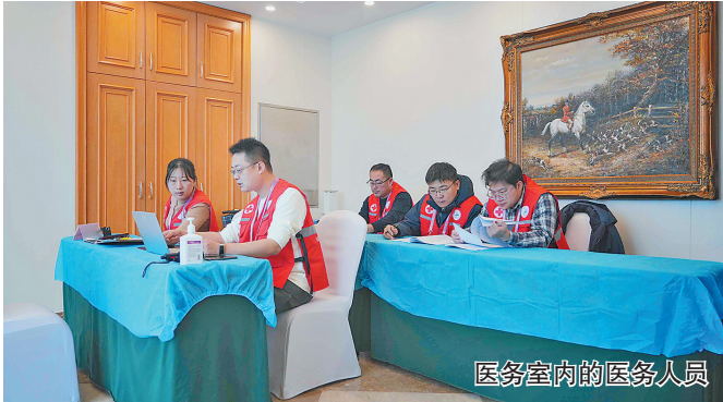
医务室内的工作人员