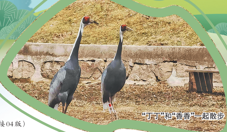
“丁丁”和“香香”一起散步