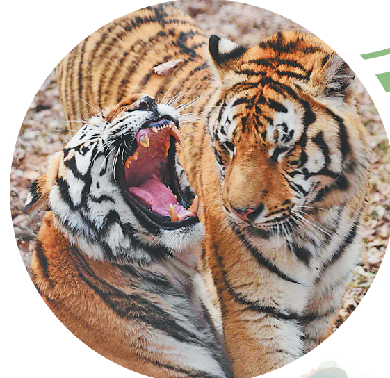
“生生”和“威威”姐弟俩

随后,它们的舞蹈盛宴开场。“丁丁”和“香香”步调一致,时而并肩跳跃,轻盈的身姿仿佛灵动的仙子;时而相互靠近,脖颈交缠,亲昵互动。它们绚丽的羽毛在日光下闪烁着迷人的光泽,随风轻轻飘动,每一个动作都饱含深情。这对情侣沉浸在只属于彼此的浪漫氛围中,用爱谱写着——一曲永恒的歌,引得无数游客为它们甜蜜的爱情驻足,送出由衷祝福。