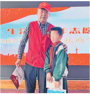
生活报志愿者慰问 背荫河镇中心学校