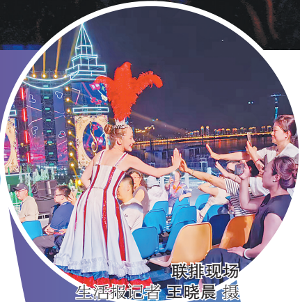
联排现场