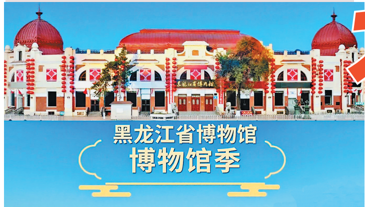
黑龙江省博物馆 博物馆季

为贯彻落实国家文物局《关于做好2025年暑期博物馆开放服务工作的通知》要求,按照省政府、省文旅厅关于《2025年黑龙江省夏季避暑旅游“百日行动”实施方案》的工作部署,黑龙江省博物馆将在暑期到来之际,开展六大系列、十八项惠民展览与活动,陪伴全国游客清凉一“夏”!