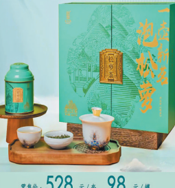
零售价: 528 元/套 98 元/罐