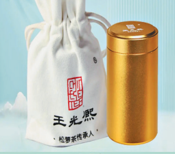
零售价: 158 元/罐