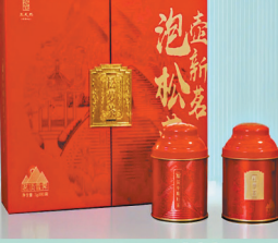
零售价: 1188 元/套 228 元/罐