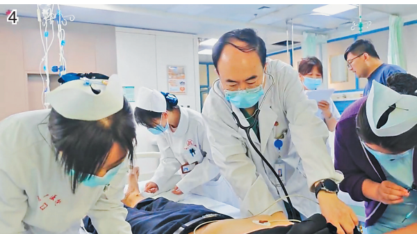
图片为视频截图 医院提供

主呼吸,能正确应答并辨识所在位置。此时大家终于松了一口气,随后众人将患者送往急诊科。