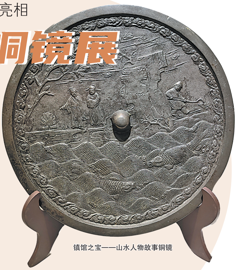
镇馆之宝——山水人物故事铜镜