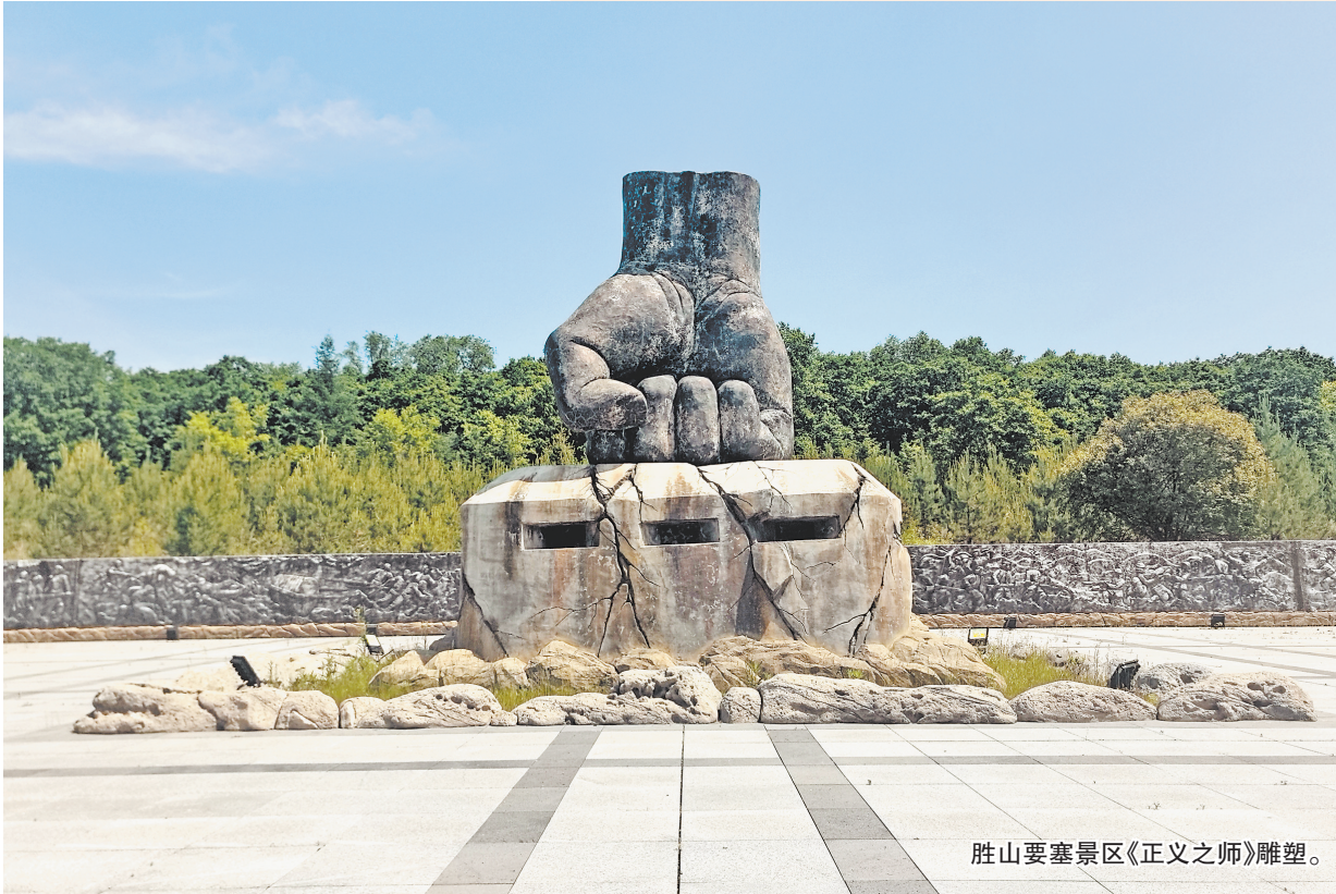
胜山要塞景区《正义之师》雕塑。

然而,日军精心构筑的“东方马其诺防线”并非固若金汤。1945年8月,苏联红军踏破“天皇”残梦。如今的残