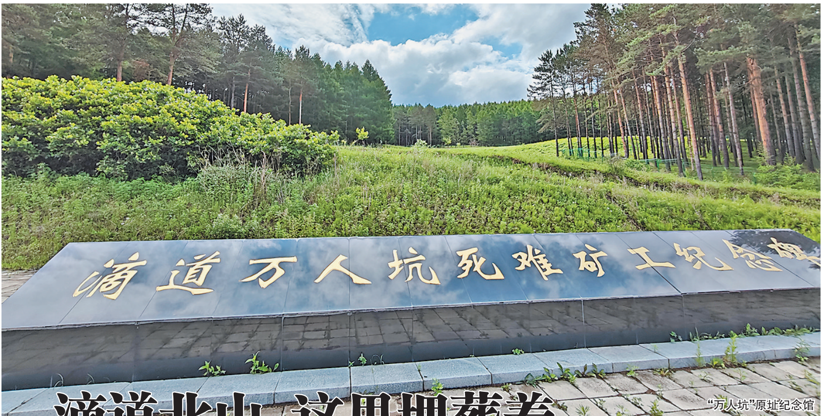
“万人坑”原址纪念馆