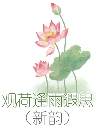
观荷逢雨遐思 (新韵)