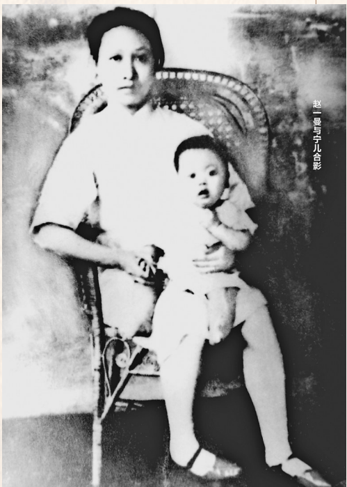
赵一曼奔赴东北抗日前线临行前,在照相馆拍下了母子间唯一的合影。

血色家书,已成永恒丰碑;精神火炬,必将代代相传。在实现中华民族伟大复兴的壮阔征程上,赵一曼和千千万万先烈用生命写就的答案——对信仰的忠贞、对家国的挚爱、对使命的担当,永远是激励我们不忘初心、砥砺前行的磅礴力量。