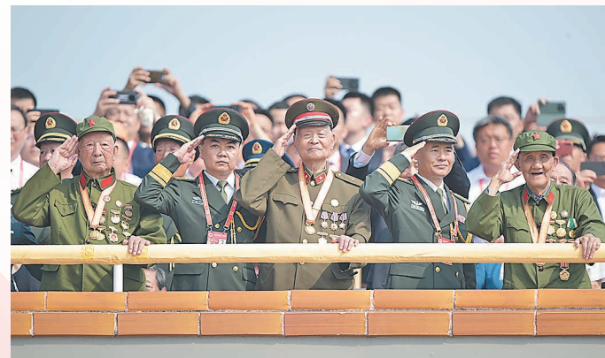
观礼的嘉宾。