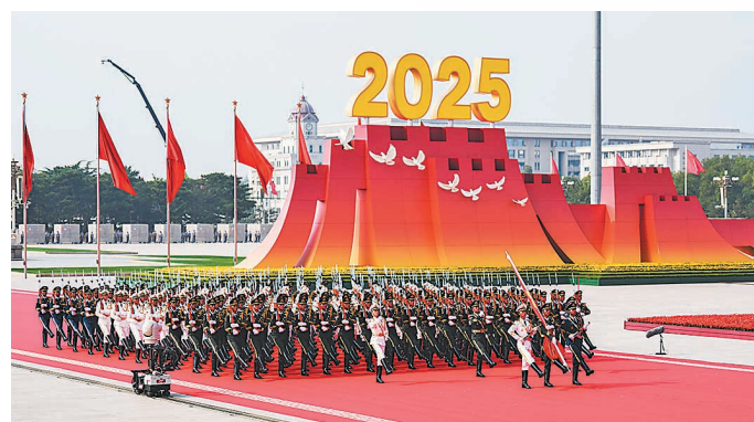
国旗护卫队从人民英雄纪念碑基座出发,走向旗杆基座。

胜利荣光从未褪色,和平信念历久弥坚。这次阅兵,不仅是对历史的回望,更是向明天宣示:珍爱和平、开创未来。中华民族将始终坚持走和平发展道路,永远铭记历史所启示的伟大真理:正义必胜!和平必胜!人民必胜!