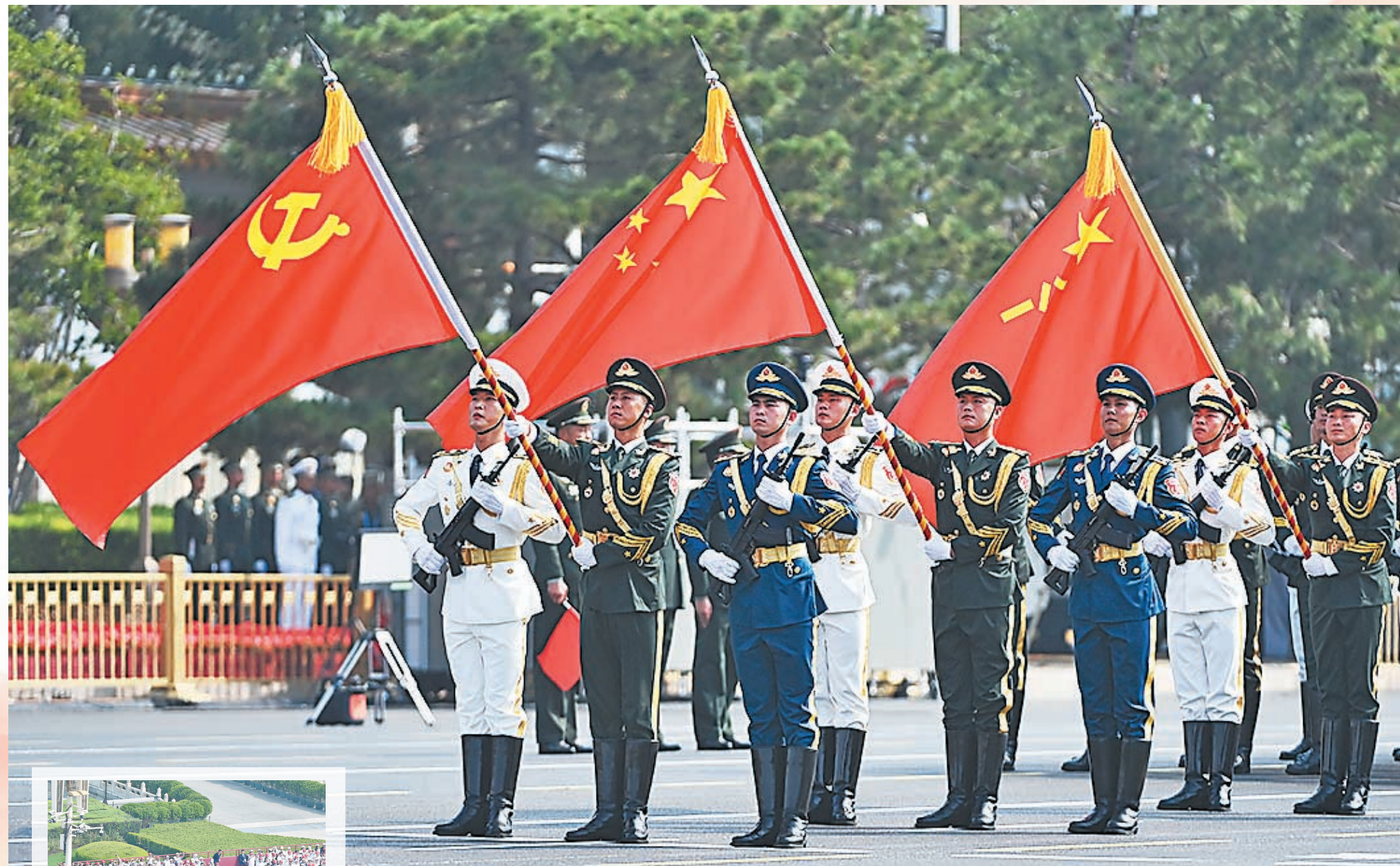
中国人民解放军仪仗方队。