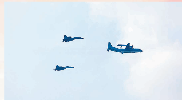
特种机梯队。