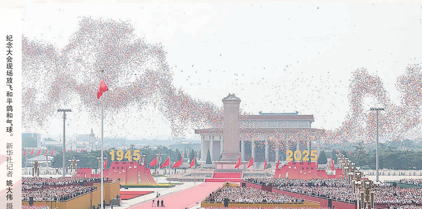
纪念大会现场放飞和平鸽和气球。