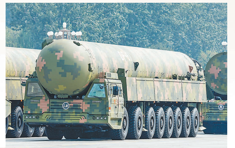
核导弹第一方队接受检阅。