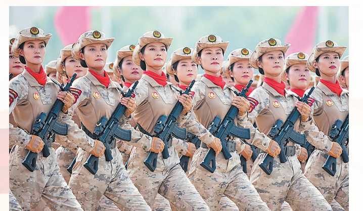
首次亮相以纪念抗战胜利为主题的阅兵活动的民兵方队。