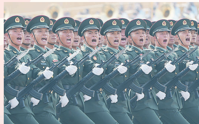
陆军方队接受检阅。