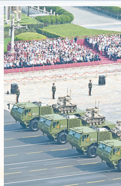
陆上无人作战方队 通过天安门广场。