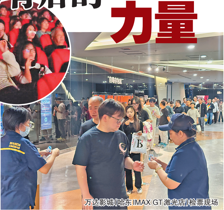
万达影城(哈东IMAX GT激光店)检票现场