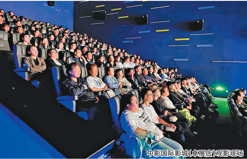
中影国际影城(卓展店)观影现场

电影《731》上映首日，刷新了两项中国影史纪录，成为中国影史单片单日总场次榜冠军和首映日总场次榜冠军。据数据显示，哈尔滨市区内70余家影城对电影《731》的排片占比均在80%以上。 上周末，记者走访多家身处核心商圈的影院时注意到，《731》排片十分密集，每场平均间隔十多分钟，其中，万达影城(哈西IMAX激光店)于9月21日9时开启当天首场放映，一直到当天23时最后一场，全天共安排了59场《731》。每场电影的间隔时间，最短为10分钟。即便23时开场的电影，放映结束后已是第二天的凌晨1时，但仍然有不少观众选择熬夜观看。 以9月21日为例，中影国际影城(卓展店)共安排了33个场次，平均半小时一场；华夏柏林影院(大商新一百店)安排了33个场次，场次最短间隔10分钟；七彩影城(观江店)共安排了38场次，平均15分钟一场。 不仅场次多，上座率也很高。据猫眼专业版数据显示，9月18日至20日，万达影城(哈西IMAX激光店)已连续三天跻身全国800家影院综合票房前三名。采访中，不少影院经理表示，电影《731》的热度直追春节档。在七彩影城(观江店)，由于观影火爆，影城经理甚至开始身兼多职，不仅帮忙检票，还承担起保洁工作。“虽然忙，但心里真高兴，希望更多人能看到这部电影，了解那段历史、铭记那段历史！”