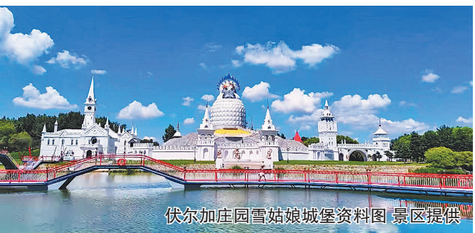
伏尔加庄园雪姑娘城堡资料图

收”的喜悦和“晒秋”的快乐。5D玻璃彩虹桥与“五花山”堪称拍照绝配。丛林魔梯,号称“懒人登山神器”。云霄飞索,一边“飞”一边看五花山。森林旱滑,带你秒回童年。