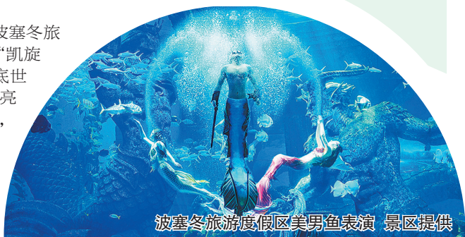
波塞冬旅游度假区美男鱼表演

这个“十一”假期,哈尔滨波塞冬旅游度假区焕新升级,重磅推出“凯旋狂欢节”主题活动。其中,海底世界的“凯旋大巡游”成为最大亮点,还有金色主题“稻浪迷宫”,全网爆火的美男鱼也将为市民和游客送上来自水下的节日祝福。沙滩水世界内,游客不出远门即可享受海岛度假乐趣。