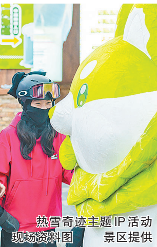
热雪奇迹主题IP活动现场资料图

占地5万平方米的雪姑娘城堡,在秋色的掩映下,更显魅力。这里不仅是摄影爱好者的天堂,更是都市人逃离喧嚣、感受异域风情的理想之地。