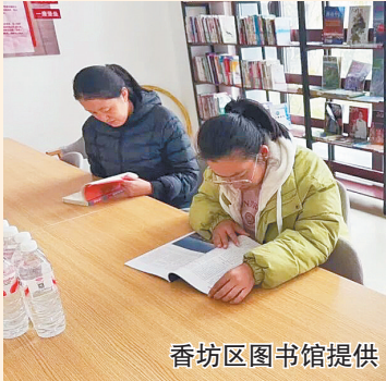
香坊区图书馆提供

体的偏好，精准调配涵盖文学、历史、健康养生、少儿读物等领域的图书与期刊逾千册。同时，香坊区图书馆还将定期下沉社区，通过举办主题阅读沙龙、少儿绘本讲读等系列活动，为各年龄段居民提供个性化阅读指导。香坊区图书馆还将与黎明街道深化合作，持续优化分馆的藏书与服务内容，让书香成为社区最具特色的名片。