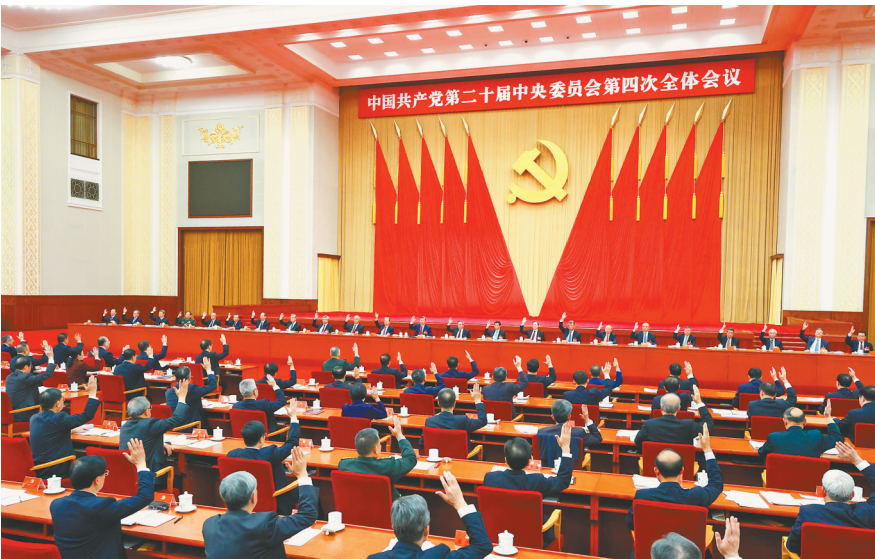
中国共产党第二十届中央委员会第四次全体会议,于2025年10月20日至23日在北京举行。中央政治局主持会议。

新华社北京10月23日电 中国共产党第二十届中央委员会第四次全体会议公报 (2025年10月23日中国共产党第二十届中央委员会第四次全体会议通过) 中国共产党第二十届中央委员会第四次全体会议,于2025年10月20日至23日在北京举行。 出席这次全会的有,中央委员168人,候补中央委员147人。中央纪律检查委员会常务委员会委员和有关方面负责同志列席会议。党的二十大代表中部分基层同志和专家学者也列席了会议。 全会由中央政治局主持。中央委员会总书记习近平作了重要讲话。 全会听取和讨论了习近平受中央政治局委托所作的工作报告,审议通过了《中共中央关于制定国民经济和社会发展第十五个五年规划的建议》。习近平就《建议(讨论稿)》向全会作了说明。 全会充分肯定党的二十届三中全会以来中央政治局的工作。一致认为,中央政治局认真落实党的二十大和二十届历次全会精神,坚持稳中求