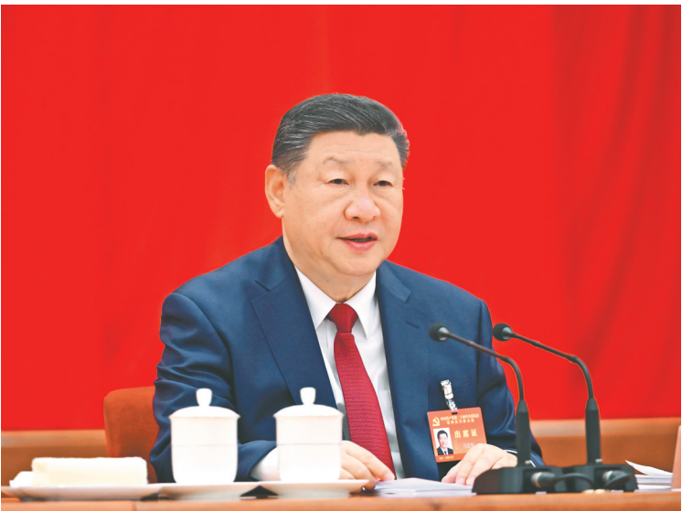
中国共产党第二十届中央委员会第四次全体会议,于2025年10月20日至23日在北京举行。中央委员会总书记习近平作重要讲话。

全会听取和讨论了习近平受中央政治局委托所作的工作报告,审议通过了《中共中央关于制定国民经济和社会发展第十五个五年规划的建议》。习近平就《建议(讨论稿)》向全会作了说明 全会决定,增补张升民为中共中央军事委员会副主席 全会号召,全党全军全国各族人民要更加紧密地团结在以习近平同志为核心的党中央周围,为基本实现社会主义现代化而共同奋斗,不断开创以中国式现代化全面推进强国建设、民族复兴伟业新局面