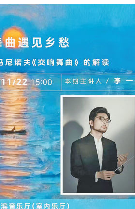
哈尔滨音乐厅(室内乐厅)

据介绍,谢尔盖·瓦西里耶维奇·拉赫玛尼诺夫是俄罗斯浪漫主义音乐的集大成者,集作曲家、钢琴家与指挥家身份于一身。他出身贵族世家,四岁由母亲启蒙习琴,后师从莫斯科音乐学院名师兹韦列夫,1892年以钢琴与作曲双金奖荣誉毕业。少年时期,他便凭歌剧《阿列科》与《小调第一钢琴协奏曲》初绽才华。然而,这位“天生的悲观主义者”一生波折不断。1897年,《d小调第一交响曲》首演失利,