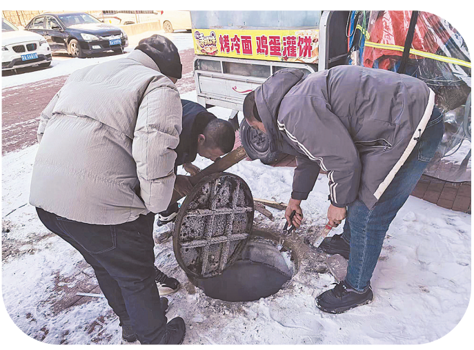
奋战,精准找到堵塞点并完成疏通。随着自来水总阀开启,供水恢复,居民们也恢复了正常生活。